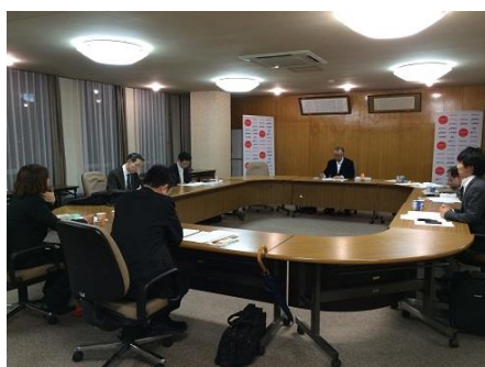
プロジェクト会議の様子