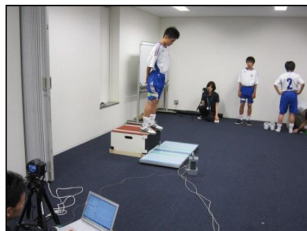
外傷予防プログラム 測定風景